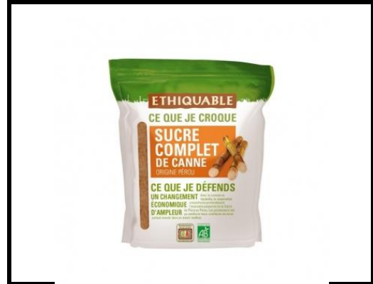
1 pot de sucre