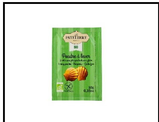
1 sachet de levure