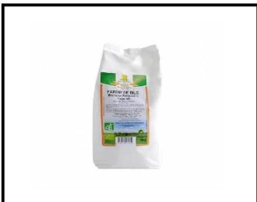
3 pots de farine