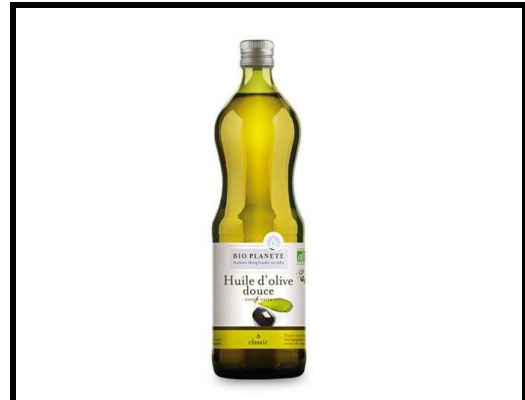
1/2 pot d'huile