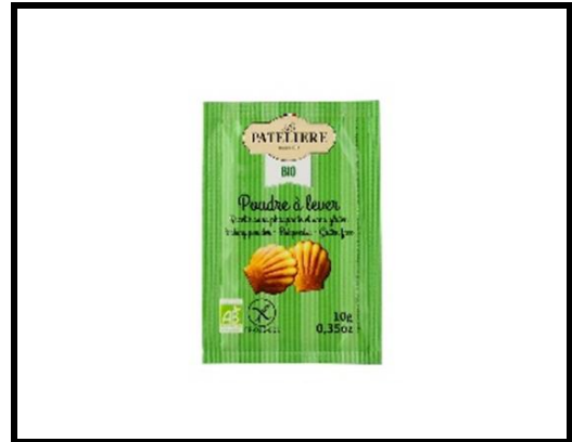
1 sachet de levure