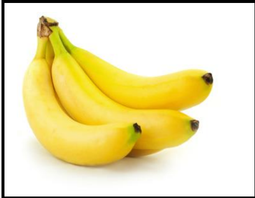
4 bananes écrasées