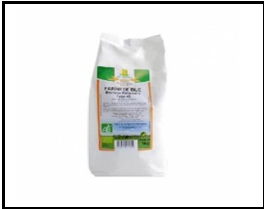
3 pots de farine