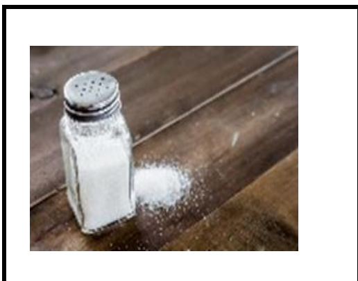
1 pincée de sel