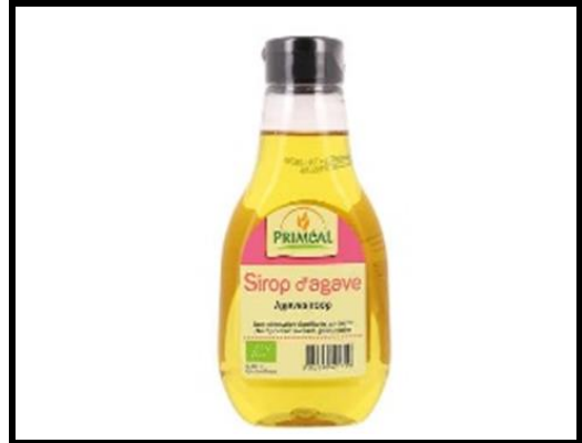
4 C. soupe sirop d'agave