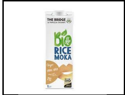
3 cuillères de lait