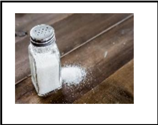
1 pincée de sel