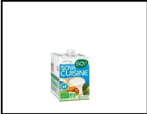
25 cl de crème