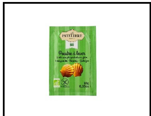
1 sachet de levure