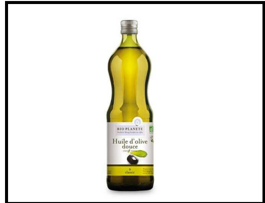
4 cuillères d'huile